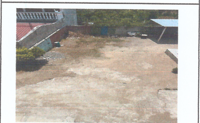
Foto 4: OTRO ÁNGULO DEL ÁREA DONDE SE CONTEMPLA CONSTRUIR LA ESTRUCTURA DE TECHO Y LOSA DE PATIO.

Observación: Si es necesario se pueden agregar hojas adicionales y actualizar el número de hojas.