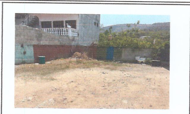
Foto 2: OTRO ÁNGULO DEL ÁREA DONDE SE CONTEMPLA CONSTRUIR LA ESTRUCTURA DE TECHO Y LOSA DE PATIO.