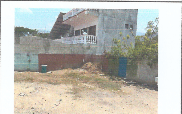
Foto 3: OTRO ÁNGULO DEL ÁREA DONDE SE CONTEMPLA CONSTRUIR LA ESTRUCTURA DE TECHO Y LOSA DE PATIO.