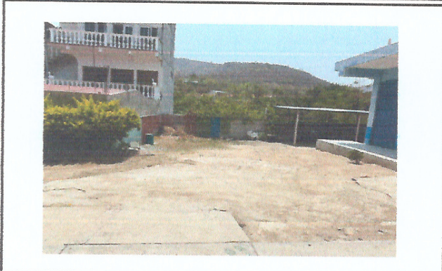
Foto 1: ÁREA DONDE SE CONTEMPLA CONSTRUIR LA ESTRUCTURA DE TECHO Y LOSA DE PATIO.